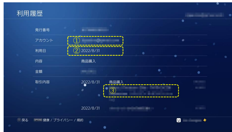
参考：PlayStation®4版 利用履歴の画面